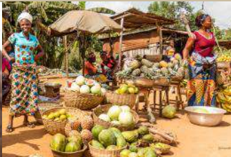
Le marché de Zé-plaque La cité palustre de Ganvié