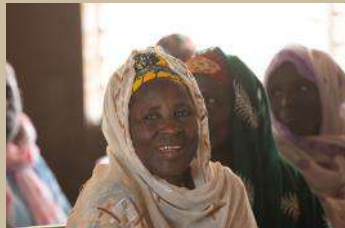
Les belles rencontres Pêche traditionnelle