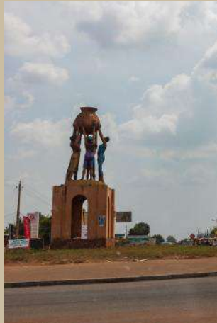
Jarre percée de Bohicon